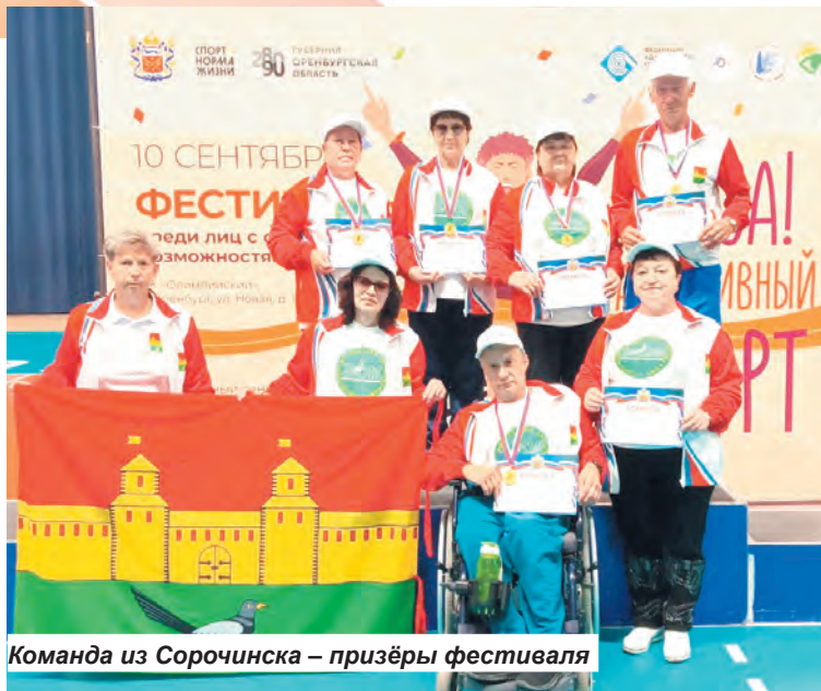
Команда из Сорочинска – призёры фестиваля